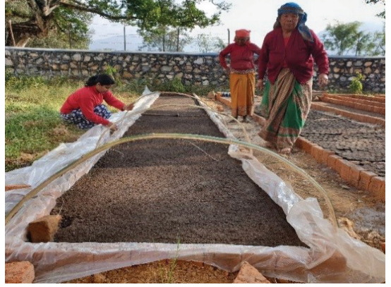
सिड बेडमा बीउ छर्ने कार्य