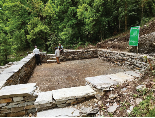
खसूवास सा.व.उ.स मोदी गा.पा. ४ क्याङ पर्वत