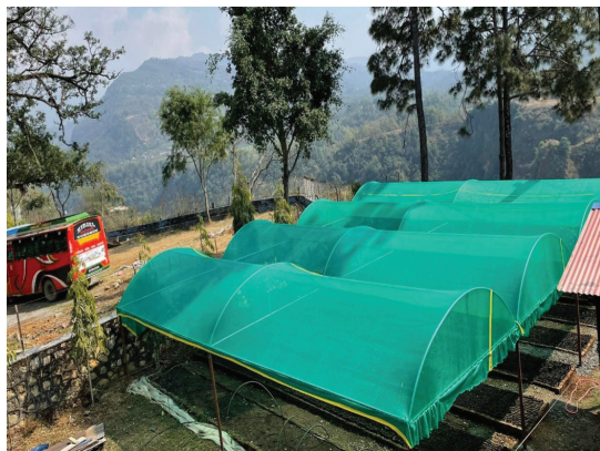
डिभिजन वन कार्यालय, पर्वतको नर्सरीको ग्रिन नेट लगायन संरचना मर्मत गरिएका