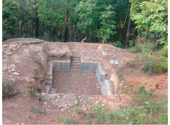
लालीगुराँस सा.व.उ.स. फलेवास न.पा. ४ पर्वत