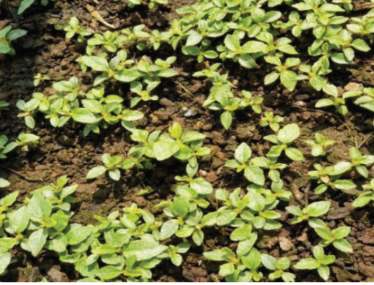
सिड बेडमा राइखन्युका बिरुवाहरु