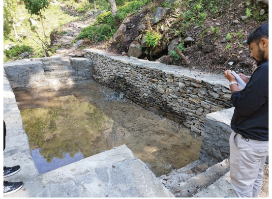
एकसल्ले सा.व.उ.स. कुश्मा न. पा. २ खुर्कोट पर्वत