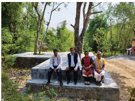
दियालो बहुउद्देश्यीय संस्था लिमिटेड कुश्मा न.पा. ९ पर्वत