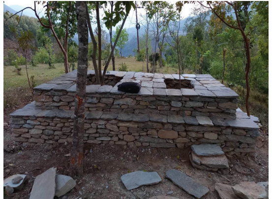
कालीबन्जर केटीचौर सा. व. उ.स. कुश्मा न.पा. २, पर्वत