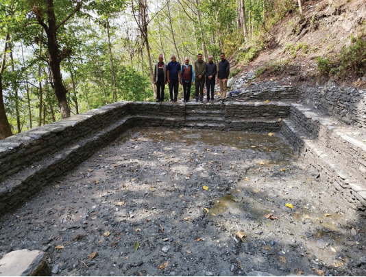
धुरपुर टाउकाखर्क सा.व.उ.स. फलेवास न.पा. ५, पर्वत