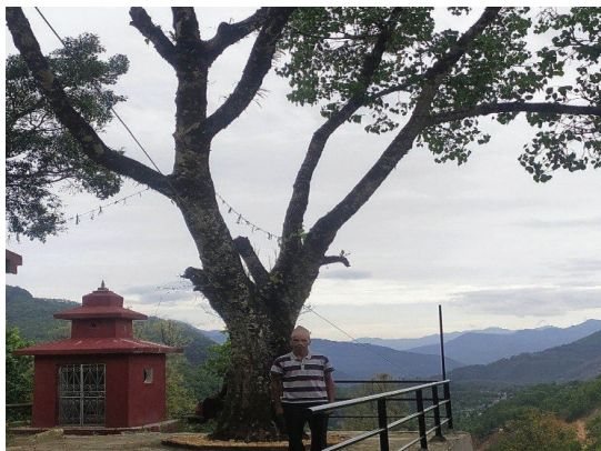
पाताल समथरी सा. व. उ.स. मोदी गा.पा. ६, पर्वत