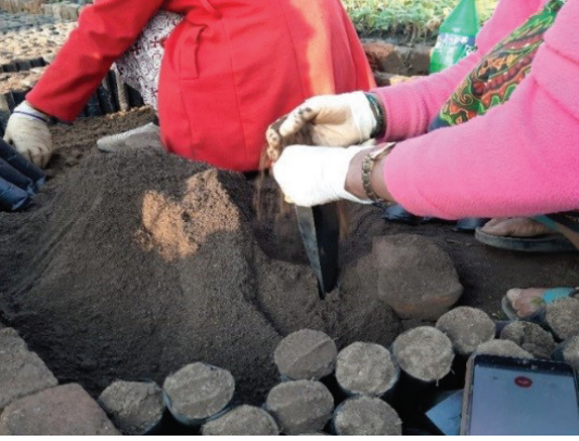
बिरुवाका लागि पोलिब्याग भरिदै